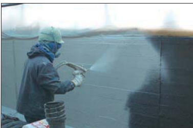
ポリウレタン樹脂塗布